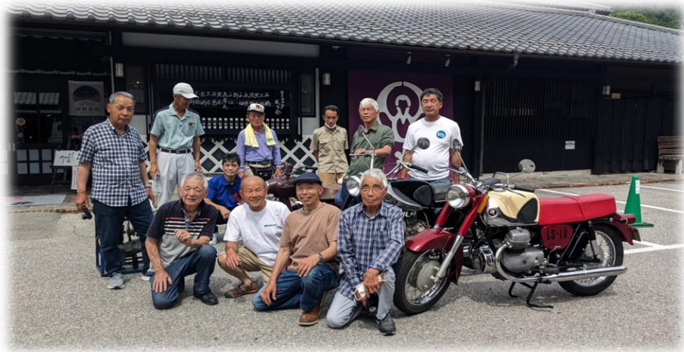
車両はLS18-2 児島号 GO GO!